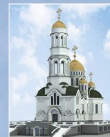
Храм в честь преподобного Серафима Саровского, мкр-н Радужный

Продолжается строительство храма в честь преподобного Серафима Саровского в г. Тамбове. В настоящее время цокольная часть храма перекрыта плитами, и на них возведен временный деревянный храм, в котором проводятся службы. Серафимовский храм станет вторым большим храмом на севере г. Тамбова и сможет вместить в себя до 1 500 человек.