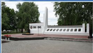
с. Караул Инжавинского района