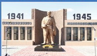
с. Вишнева Ржаксинского района