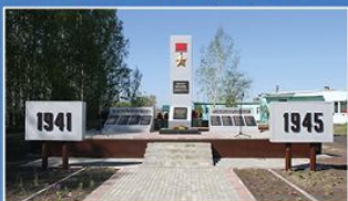
с. Княжево Знаменского района