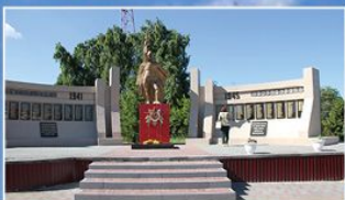
с. Покрово-Марфино Знаменского района