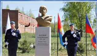
с. Керша Бондарского района