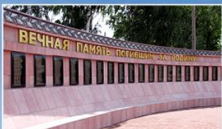
п. Ржакса Ржаксинского района