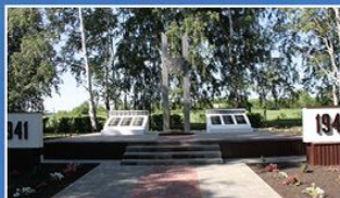
с. Никитино Инжавинского района