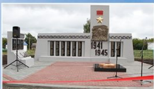
с. Сабурово-Покровское Никифоровского района