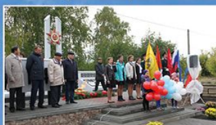
с. Мельгуны Мордовского района