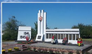
с. Куржное Мордовского района